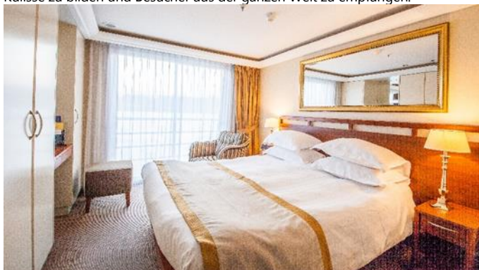
MS Klimt, Doppelkabine Cello- bzw. Violindeck

Haag, Zoetermeer und Venlo ist im Jahr 2022 Almere an der Reihe, die grüne Kulisse zu bilden und Besucher aus der ganzen Welt zu empfangen.