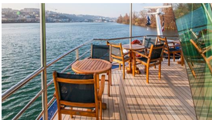
MS Klimt, Cellodeck, Außenbereich