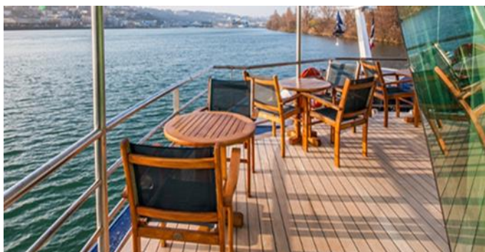
MS Klimt, Cellodeck, Außenbereich