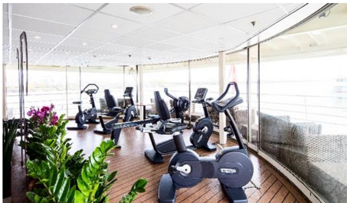
MS Nestroy, Fitnesscenter