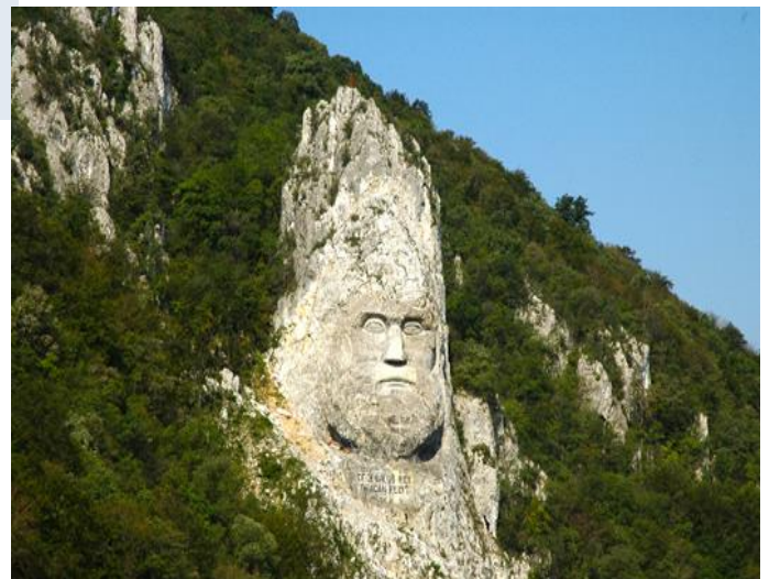
König Decebalus / „Eisernes Tor“