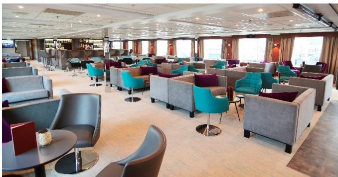
MS Nestroy, Bar/Lounge