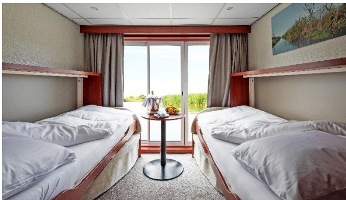
MS Nestroy, Zweibett-Kabine Schiller- bzw. Goethedeck