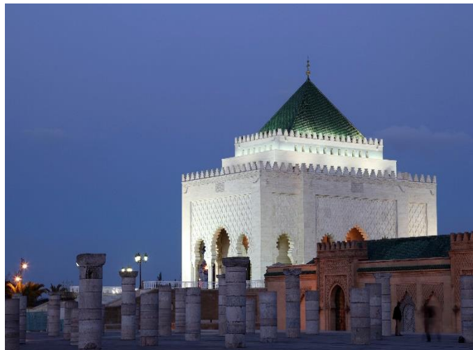
Rabat Mausoleum Mohammed V

Für die Einreise nach Marokko benötigen österreichische Staatsbürger einen Reisepass, der bei Einreise noch 6 Monate gültig sein muss. Österreichische Staatsbürger können sich für touristische Zwecke bis zu 3 Monate visumfrei in Marokko aufhalten Bitte kontrollieren Sie zur Sicherheit rechtzeitig die Gültigkeit Ihrer Reisedokumente. Weiters raten wir zur Sicherheit eine Kopie des Reisepasses auf die Reise mitzunehmen.