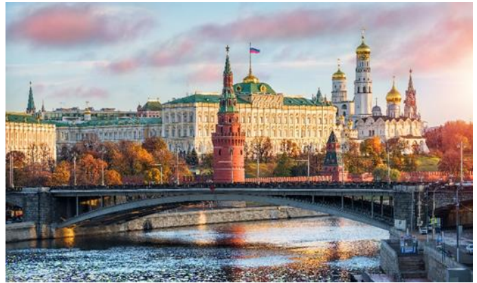
Moskawa und Kreml, Moskau

Die Einreise nach Russland (Russische Föderation) ist für österreichische StaatsbürgerInnen mit einem „E-Visum“ möglich. Dieses muss vor Reiseantritt selbst online beantragt werden. Bei Buchung benötigen wir als Reiseveranstalter eine Kopie des für diese Reise gültigen und genutzten Reisepasses.