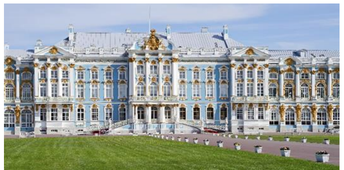
Katharinenpalast, St. Petersburg

Veranstalter: GTA-SKY-WAYS Reiseveranstaltungs GesmbH