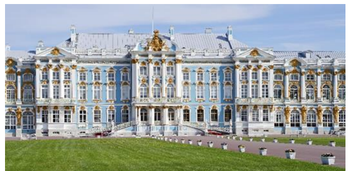
Katharinenpalast, St. Petersburg

Es gelten die verbindlichen Geschäftsbedingungen des Veranstalters publiziert auf der Homepage www.gta.at . Alle Preisangaben sind in Euro und gelten pro Person. Preis- und Programmänderungen sowie Tippfehler vorbehalten. Bitte beachten Sie die 2G-Regel! © Copyright - Alle Fotos sind urheberrechtlich geschützt und sind nicht zur Weiterverwendung gedacht. Veranstalter: GTA-SKY-WAYS Reiseveranstaltungs GesmbH