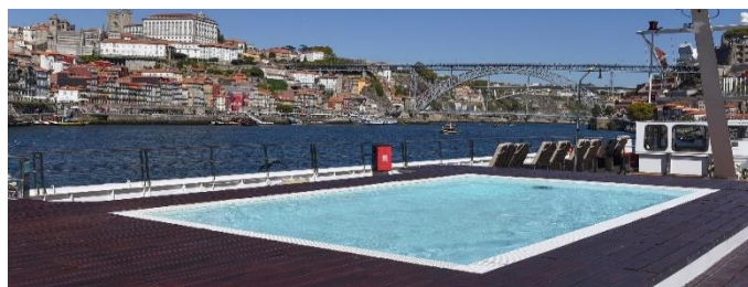
Pool am Sonnendeck

*Kat. G & J: keine Einzelbelegung möglich