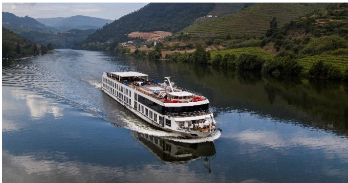
MS Douro Spirit