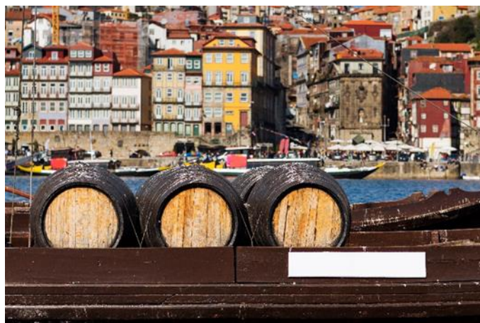
Rabelo Boot, Porto