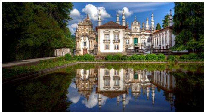
Schloss Mateus, Vila Real