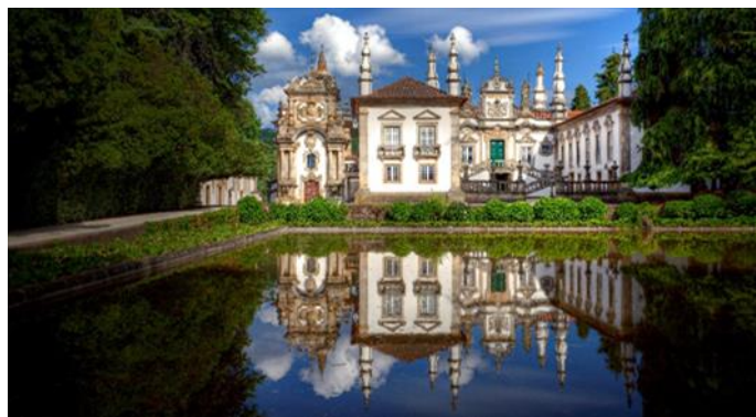
Schloss Mateus, Vila Real