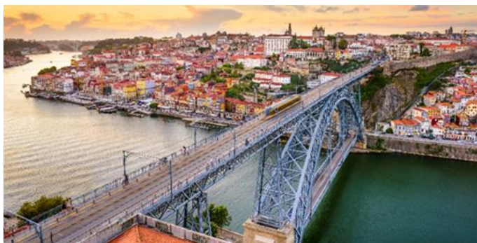
Dom Luis Brücke, Porto