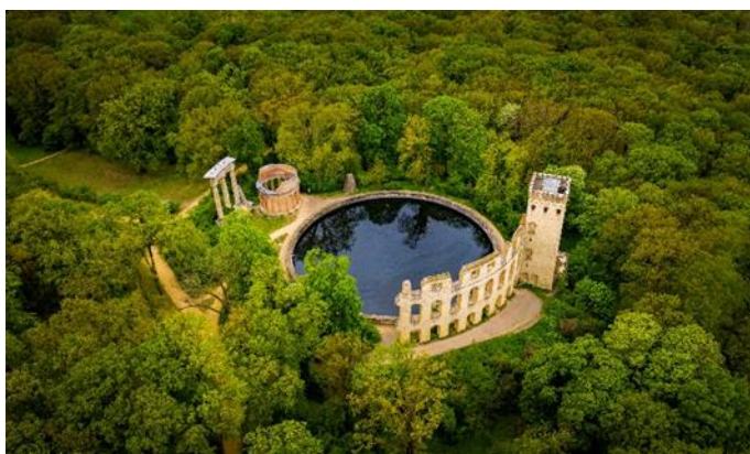
Potsdam, Park Sanssouci Ruinenberg

(Code 16.04., 30.04., 11.09., 25.09.: APBERTCHOPKIL) (Code 23.04., 07.05., 18.09., 02.10.: APKILTCHOPBER)