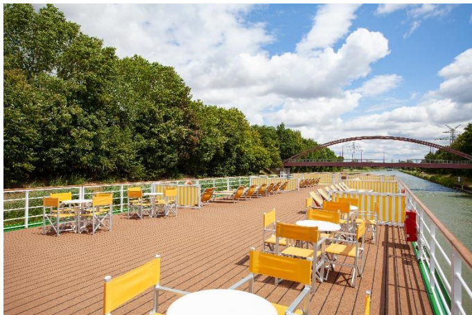
MS Thurgau Chopin, Sonnendeck