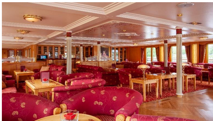
MS Thurgau Chopin, Panoramasalon

Bitte beachten Sie unsere Geschäftsbedingungen auf https://www.gta.at/geschaeftsbedingungen/