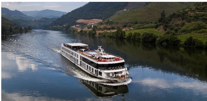
MS Douro Spirit