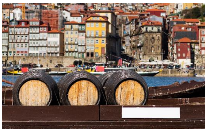
Rabelo Boot, Porto