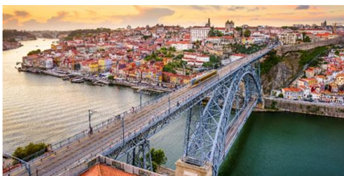
Dom Luis Brücke, Porto