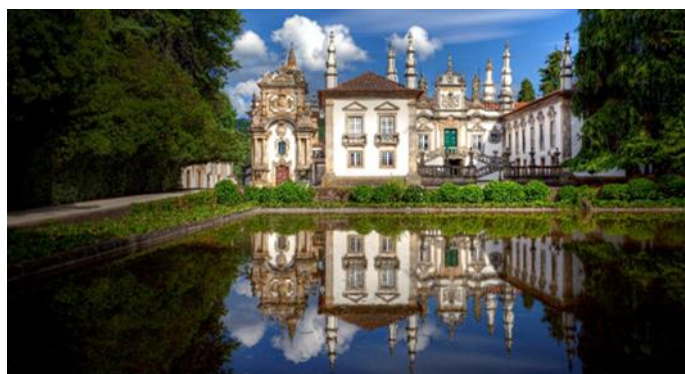
Schloss Mateus, Vila Real