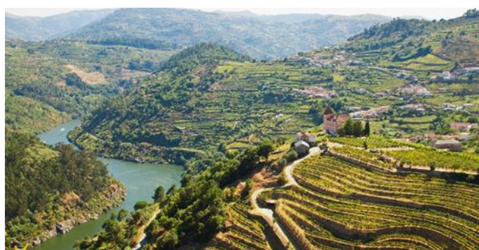
Weinterrassen Douro Tal