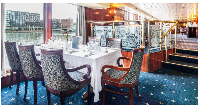
MS Aurora, Restaurant