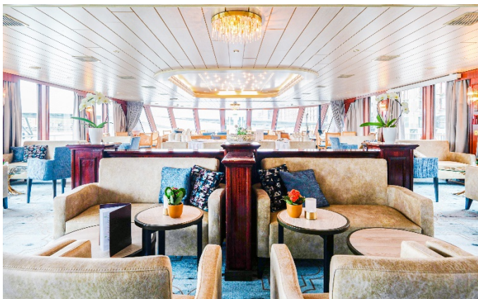
MS Aurora, Bar/Lounge