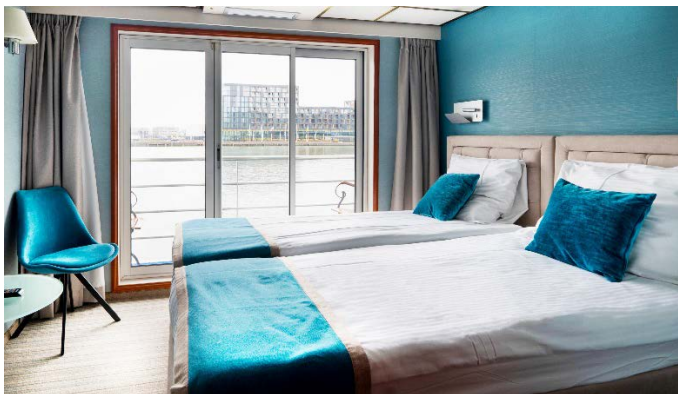
MS Aurora, Doppelkabine Oberdeck mit Privatbalkon