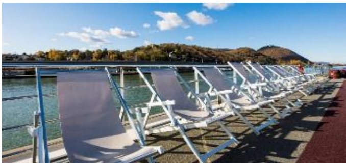
MS Nestroy, Sonnendeck