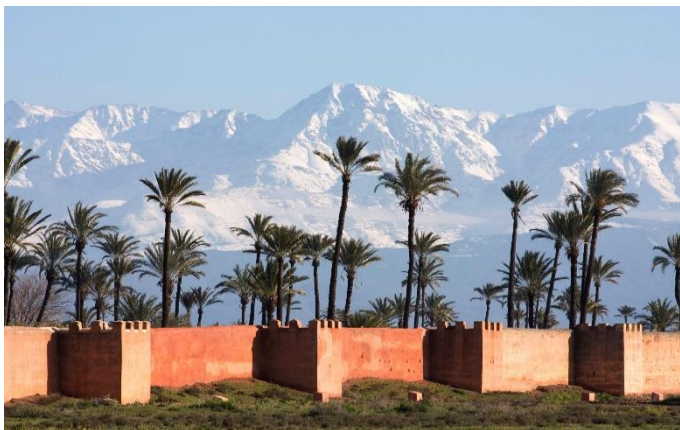
Marrakech, Hoher Atlas

Für die Einreise nach Marokko benötigen österreichische Staatsbürger einen Reisepass, der bei Einreise noch 6 Monate gültig sein muss. Österreichische Staatsbürger können sich für touristische Zwecke bis zu 3 Monate visumfrei in Marokko aufhalten Bitte kontrollieren Sie zur Sicherheit rechtzeitig die Gültigkeit Ihrer Reisedokumente. Weiters raten wir zur Sicherheit eine Kopie des Reisepasses auf die Reise mitzunehmen.