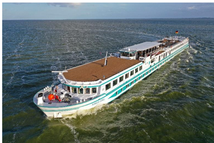
MS Junker Jörg