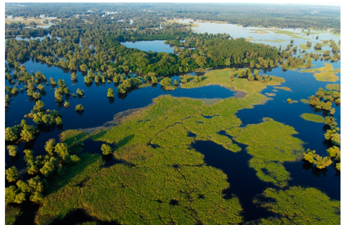
Nationalpark Kopački rit