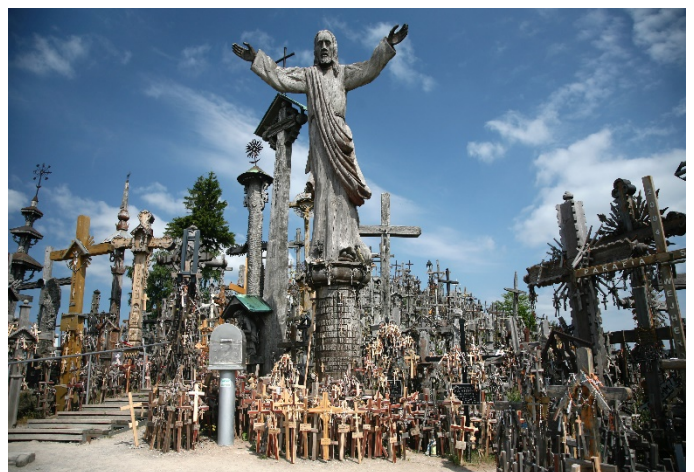
Berg der Kreuze