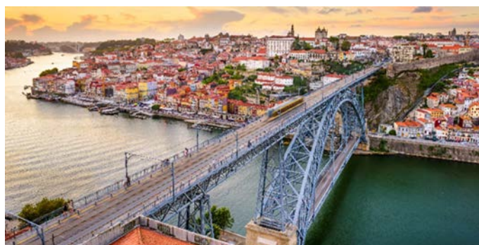
Dom Luis Brücke, Porto