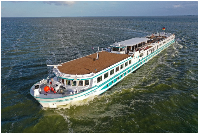
MS Junker Jörg