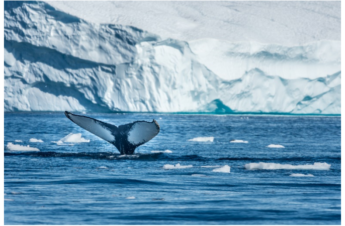
Buckelwal in der Diskobucht, Grönland