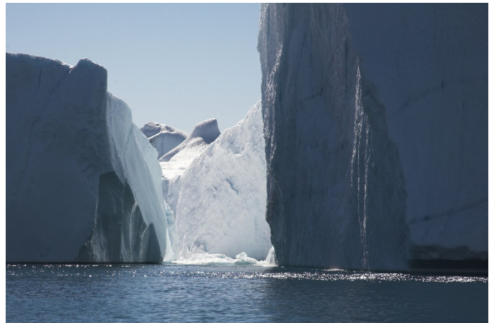
Eisberge in Grönland