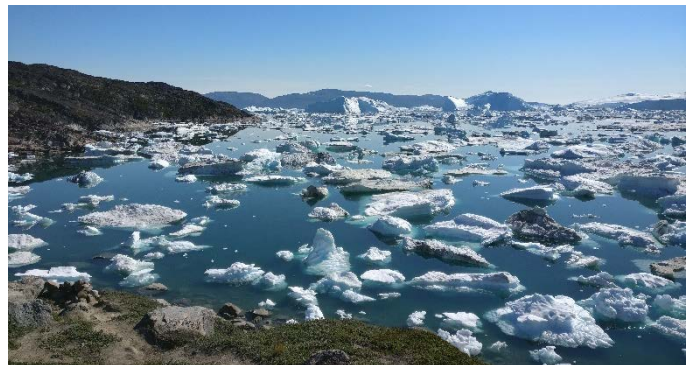
Eisfjord Ilulissat