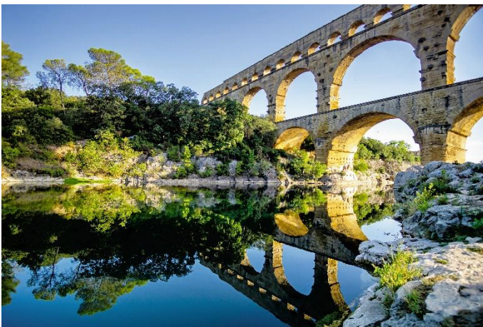
Pont du Gard

Änderungen des Reiseverlauf und Ausflugsprogramm bleiben vorbehalten.