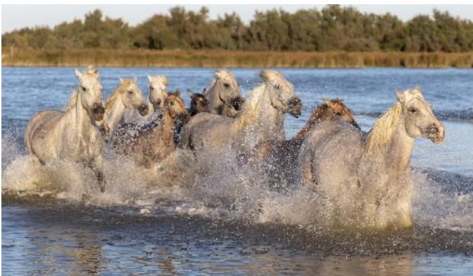
Camargue, weiße Pferde

Rundgang Arles mit Besuch der Arena Ausflug Pont du Gard Hinweis: fakultative Ausflüge nur an Bord buchbar