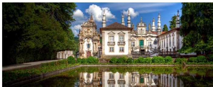
Schloss Mateus, Vila Rea

**Kat. E & F: Doppelbett mit 1,40 m breiter Matratze