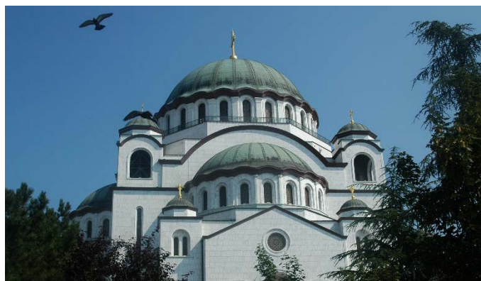
HI. Save in Belgrad