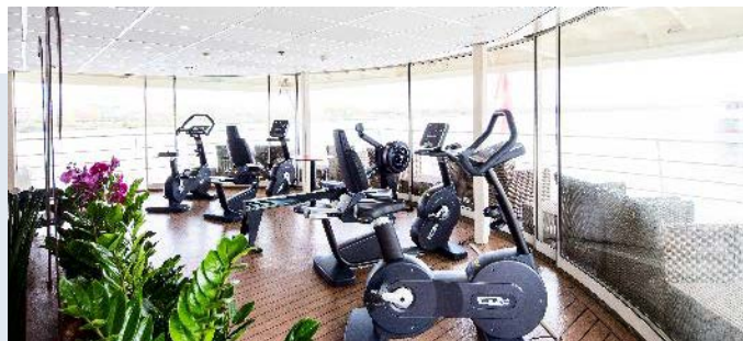
MS Nestroy, Fitnesscenter mit Panoramaaussicht

Kabine „Roulette“: Mit Erstellung der Reiseunterlagen wird eine Kabine nach dem Glücksprinzip (per Zufall) zugelost. Doppelkabinen können auch als Twinbed-Variante gestellt werden, bitte bei Buchung angeben! *Kat. E & F: keine Einzelbelegung möglich