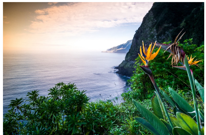
Papageienblume an der Küste, Madeira