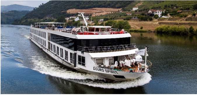
MS Douro Spirit