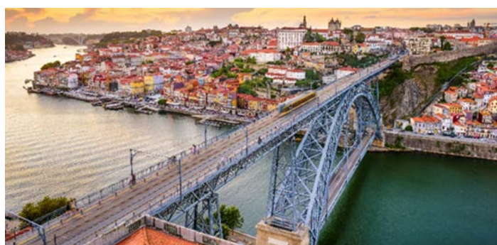
Dom Luis Brücke, Porto