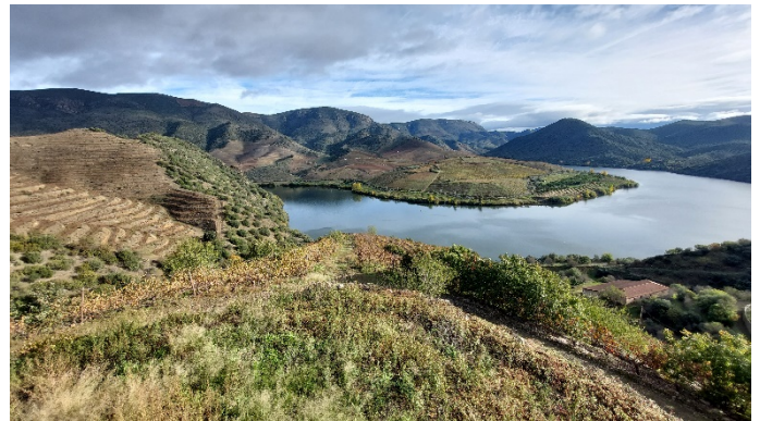
Impression während der Wanderung