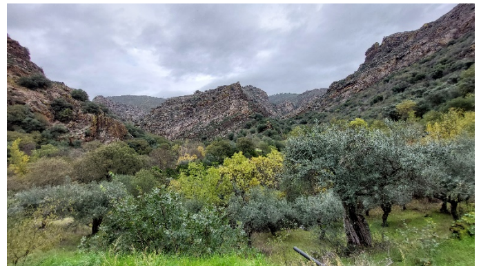
Impression während der Wanderung

Nach einem letzten Frühstück sagen wir der MS Douro Spirit Lebewohl und treten die Heimreise an.