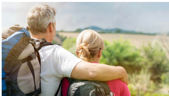
Aktive Erkundung der Destinationen

**Kat. E & F: Doppelbett mit 1,40 m breiter Matratze