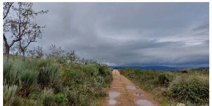
Impression während der Wanderung