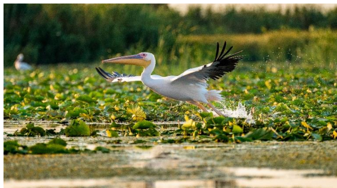
Pelikan im Donaudelta

In der Kat. B / Grillparzerdeck nur PLUS € 400 Aufzahlung für eine Kabine zur Alleinbenutzung Limitierte Verfügbarkeit