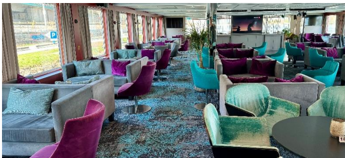
MS Nestroy, Bar/Lounge