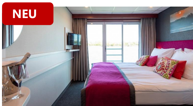
MS Nestroy, Doppelkabine Schiller- / Goethedeck