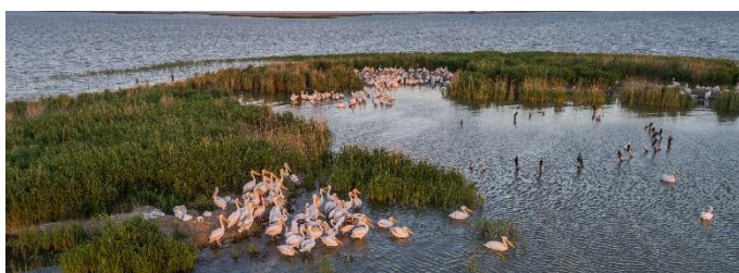
Pelikane im Donaudelta