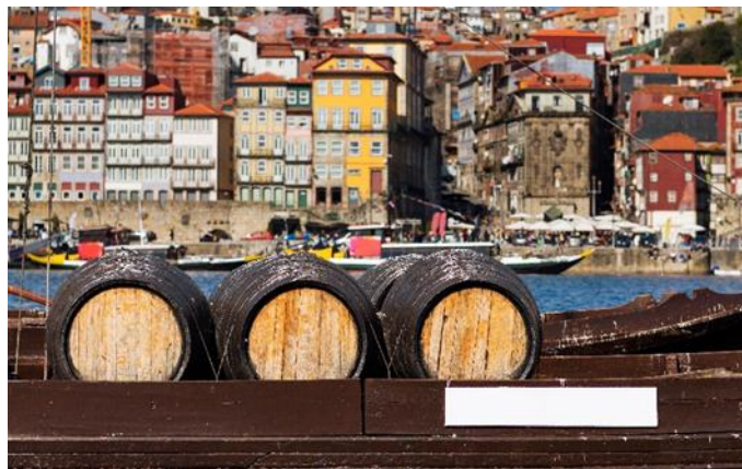
Rabelo Boot, Porto