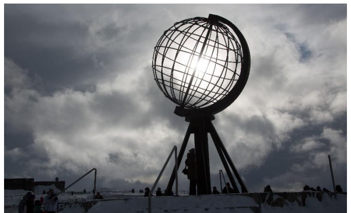
Nordkap Kugel im Winter