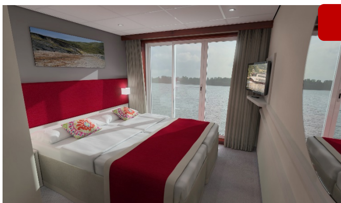
MS Nestroy, Beispielbild Doppelkabine Schiller- / Goethedeck © Illustration stinova GmbH & Design-Cell-Europe