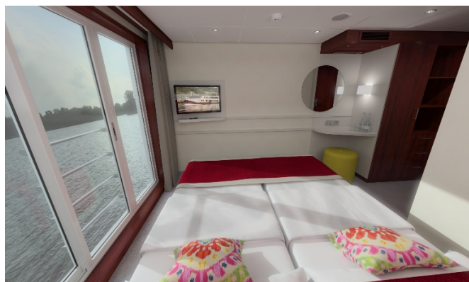
MS Nestroy, Beispielbild Doppelkabine Schiller- / Goethedeck © Illustration stinova GmbH & Design-Cell-Europe