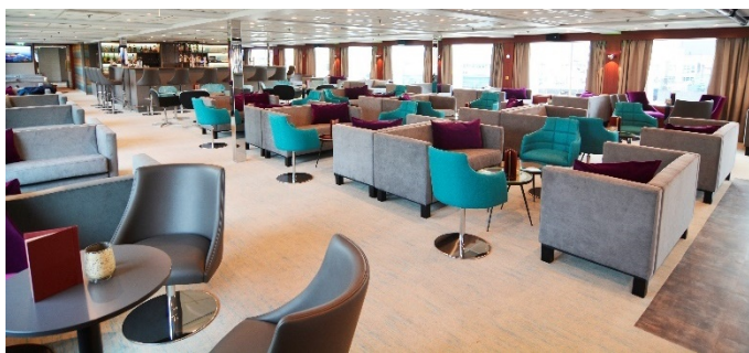
MS Nestroy, Bar/Lounge