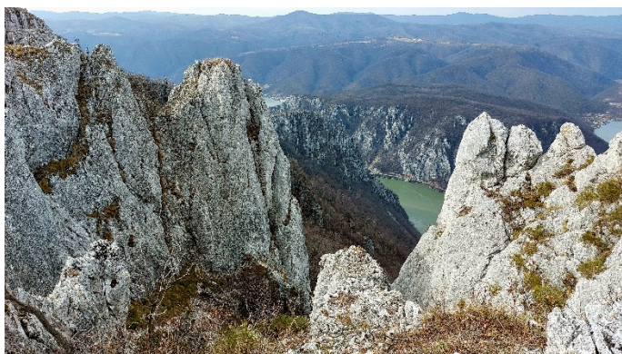
Wanderung Derdap Nationalpark