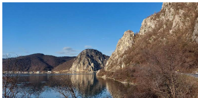
Eisernes Tor